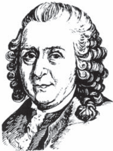
Рис. 2. Карл Линней (1707–1778)

В 1670 г. английский химик и физик Роберт Бойль (1627–1691) впервые поставил экологический эксперимент по действию на организмы низкого атмосферного давления. Он выяснил, что наибольшей стойкостью к вакууму обладают водные, земноводные и другие холоднокровные животные, и объяснил это их образом жизни.