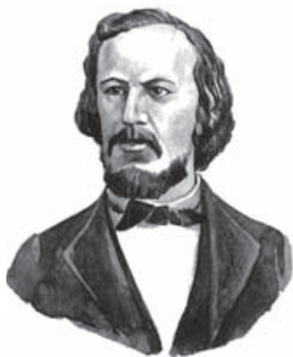
Рис. 1. Эрнст Геккель (1834–1919)

Возникла необходимость изучения конкретных взаимоотношений между популяциями разных видов в природе, между живыми организмами и окружающей средой. И к середине XIX в. постепенно оформилась самостоятельная научная дисциплина — экология.