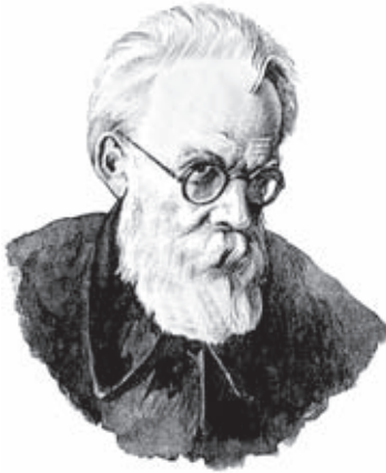
Рис. 4. В.И. Вернадский (1863–1945)

В 1926 г. вышел в свет труд Владимира Ивановича Вернадского (рис. 4) «Биосфера», где впервые была показана планетарная роль совокупности живых организмов — «живого вещества», определены его роль и функции в эволюции биосферы.