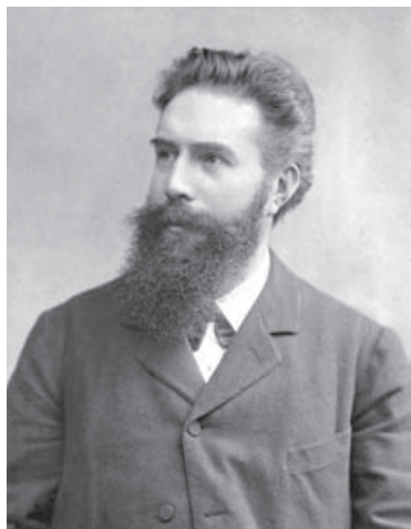
Рентген Вильгельм Конрад (1845—1923)

Начало использования рентгентехники относится к XIX в., когда успехи биологии, физики, химии и других наук помогли медицине найти более эффективные способы распознавания и лечения болезней. Особый вклад в развитие медицины внесло открытие рентгеновских лучей, которое совершило настоящую революцию в диагностике различных заболеваний у человека и животных.