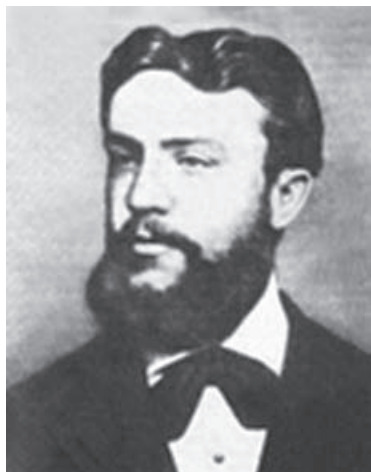
Пулюй Иван Павлович (1845—1918)

В 1880—1882 гг. он подробно описал видимые катодные лучи. Некоторое время серийно выпускалось устройство, известное как «лампа Пулюя», представлявшее собой газоразрядную лампу. В 1883 г. им был опубликован труд: «Сияющая электронная материя и четвертое состояние вещества» (Strahlende