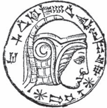
Навуходоносор II, автор неизвестен, камея

В конце жизни (то есть в предстарческом возрасте) Навуходоносор II впал в помешательство. По Библии он был отлучен от людей, ел траву, как вол, мылся под дождем (см.: Дан. 4:30). Воображал себя