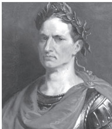
Гай Юлий Цезарь

Военное искусство Цезаря включало быстрое оперативное реагирование, смену решений (и в Испании, и в Галлии, и в Британии, и в Египте). Человек с психическими расстройствами на такие быстрые перемены не способен. Кроме того отметим, еще два эпилептика без психических нарушений были великими полководцами: Наполеон Бонапарт и Александр Македонский.