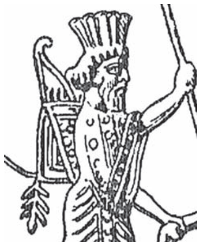
Камбиз Персидский, Википедия

Известно, что Камбиз страдал «священной болезнью» и часто предавался пьянству (при эпилепсии это нередко). В припадке ярости убил своего брата Бардина (возможно, это был и обдуманый поступок в борьбе за власть). Знаменитый древнегреческий историк Геродот пишет, что Камбиз после эфиопского похода оказался «поражен безумием», но добавляет, что и прежде он был «не в своем уме». Во всяком случае, увидев после возвращения из Эфиопии веселившихся египтян, царь простых людей казнил, жрецов велел высечь. Зверства продолжались: Камбиз избил до смерти свою беременную жену, Роксану, поразил стрелой сына своего друга, велел заживо похоронить 12 вельмож.