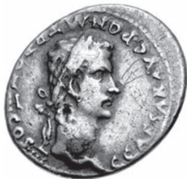
Калигула, изображение на монете

Этот римский император правил с 37 по 41 гг. н. э., был убит. Родился Калигула в 12 г. н. э. До сих пор он является объектом пристального внимания со стороны психиатров, его личность неоднократно подвергали психиатрическому исследованию. Впрочем, есть и те, кто отказывается признавать Калигулу душевнобольным. Есть даже сайт «Гай Юлий Калигула», на котором его злодеяния отрицаются. Вопрос заключается в следующем: могут ли люди XXI в. противоречить наблюдениям его великих современников, среди которых Плиний Старший (23–79 гг. н. э.) и Светоний (70–122(?) гг. н. э.)?