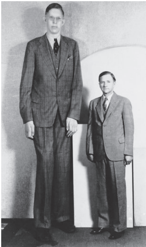
Рис. 1.4. Р. Першинг Вадлоу со своим отцом

Джона Хантера. На вскрытии исследователь обнаружил увеличенное турецкое седло (размерами 21 \times 24 \times 11 мм). Х. Кушинг выдвинул гипотезу об общих этиологических факторах гигантизма и акромегалии. Вслед за этим исследователь показал, что клинические проявления акромегалии могут уменьшаться после частичной гипофизэктомии, что свидетельствовало о причинности патологии гипофиза в развитии этих заболеваний.