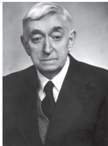
Рис. 1. Академик Академии медицинских наук СССР Василий Гаврилович Баранов (7 января 1900 — 2 марта 1988)

Василий Гаврилович Баранов был уникальным ученым, определившим направления развития отечественной эндокринологии на многие годы вперед — большое количество его разработок опередило достижения мировой клинической медицины.